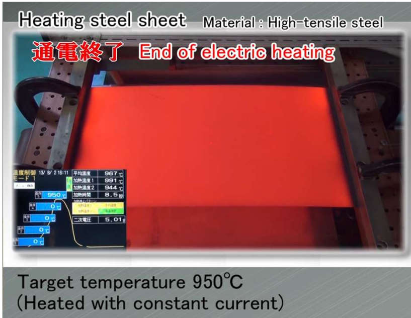
板 flat steel